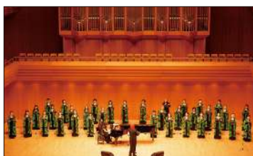
神楽坂女声合唱団