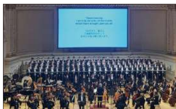
六本木男声合唱団ZIG-ZAG